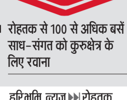
रोहतक से 100 से अधिक बसें साध-संगत को कुरुक्षेत्र के लिए रवाना