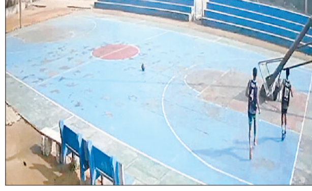
महम। बास्केट बॉल ग्राउंड पर लगे सीसीटीवी कैमरे में कैद तस्वीरें।