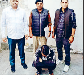
रोहतक। आरोपित पुलिस की गिरफ्त में।

जिला पुलिस की साइबर थाना की टीम ने मनी लॉन्ड्रिंग का झूठा केस दिखाकर करीब 10 लाख रुपये की हुई धोखाधड़ी करने की वारदात में शामिल रहे चौथे आरोपी को गिरफ्तार किया। आरोपी को पेशा अदालत किया गया है। मामले की गहनता से जांच की जा रही है।